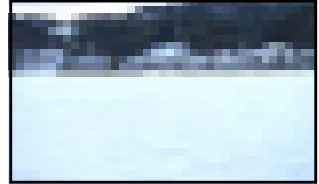
↓ 水たまりに張った氷