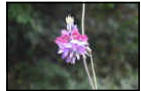
希望ヶ丘のクズの花