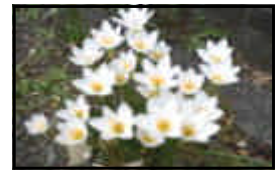
中庭のタマスダレ