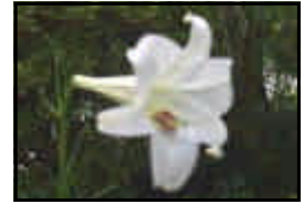
玄関前のササユリ