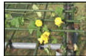
校庭のヘチマの花