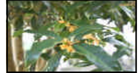
↑中庭のキンモクセイ