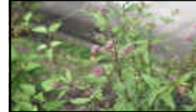
↑玄関のフジバカマ