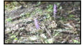
↑西校舎のヤブラン

保護者・地域の皆様も、旬の食べ物を味わいながら命をいただいていることや食糧問題等についてご家族で考えていただければ幸いです。11月下旬には人権旬間を予定しています。さらに「命」を大切にする気持ちをはぐくんでいきたいと思っておりますので今後ともご理解、ご協力をよろしくお願いいたします。