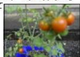
↑2年生のミニトマト