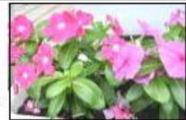
↑花植えボランティア活動をした日日草

最後に安全についてのお願いです。学期末に交通安全指導や不審者対応策だけでなく、水泳学習はできなくても水の事故防止についても詳しく指導しました。地域・家庭でも、体で覚え、習慣化するまで繰り返し教えていただきますようよろしくお願いいたします。