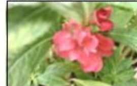
↑3年生のホウセンカ