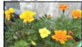
↑3年生のマリーゴールド